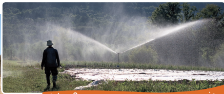
3 ha, Creuse : maraîchage en biodynamie