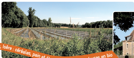
16 ha, Isère : céréales, pain et élevage de poules pondeuses en bio